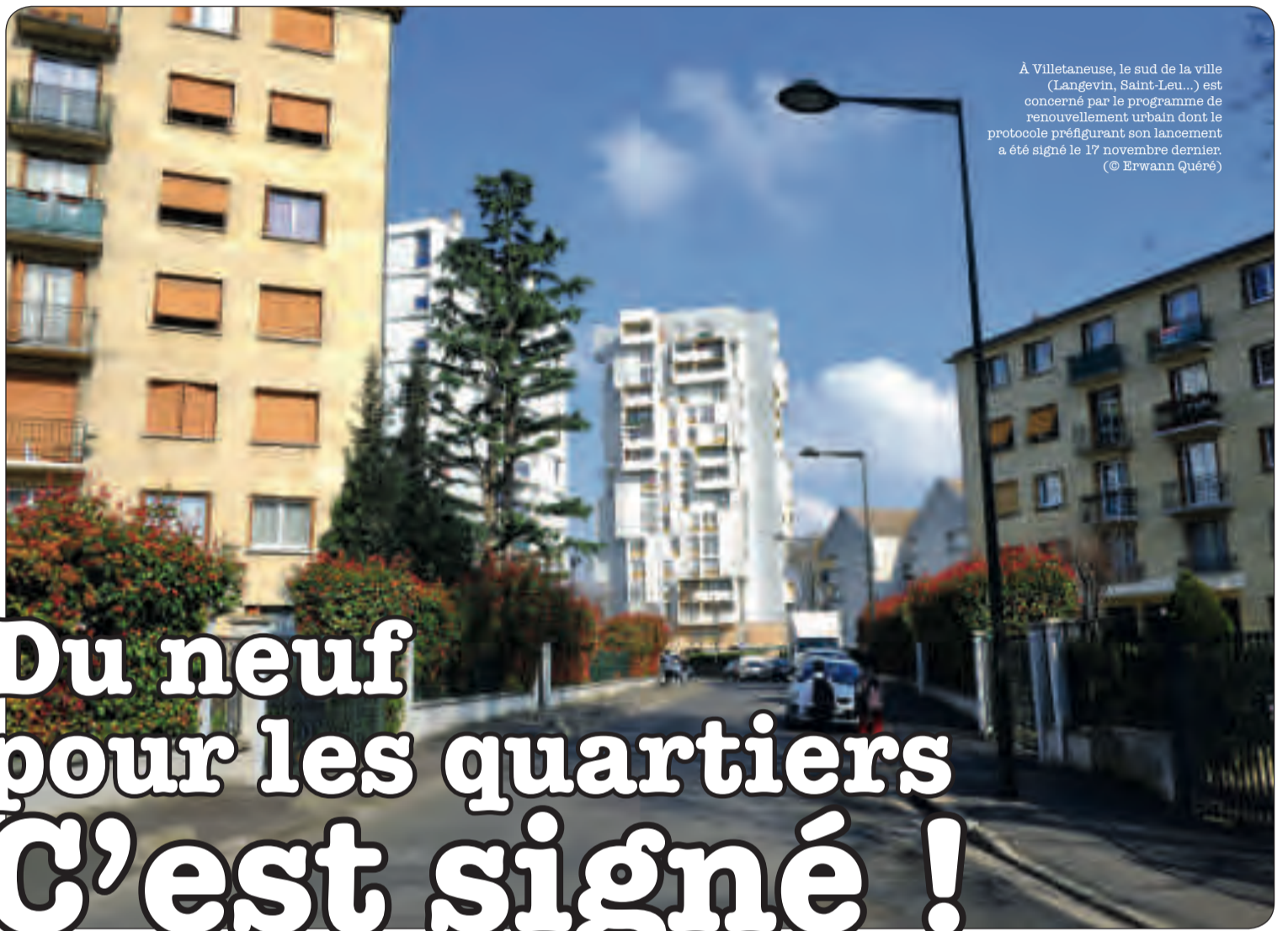
À Villetaneuse, le sud de la ville (Langevin, Saint-Leu...) est concerné par le programme de renouvellement urbain dont le protocole préfigurant son lancement a été signé le 17 novembre dernier.

Le 17 novembre dernier, Patrick Braouezec et les 9 maires des villes ont signé le protocole qui préfigure les projets de renouvellement urbain des quartiers de Plaine Commune avec Patrick Kanner, ministre de la Ville, de la Jeunesse et des Sports, Hélène Geoffroy, secrétaire d'Etat et les nombreux partenaires impliqués. Voir page 3.